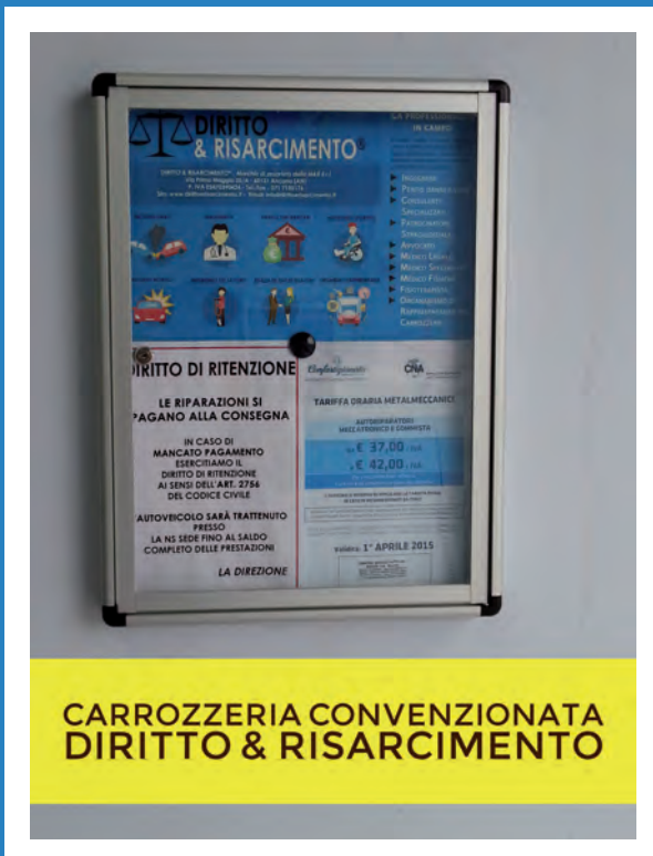
CARROZZERIA CONVENZIONATA DIRITTO & RISARCIMENTO